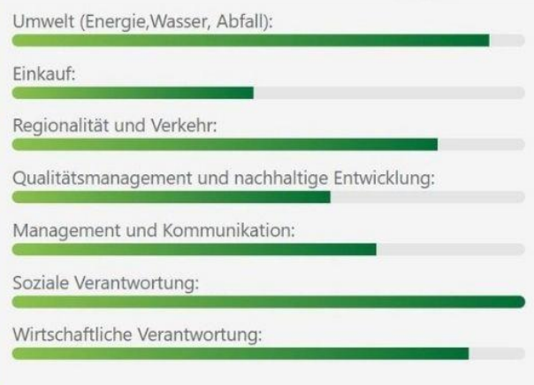
Bild: GreenSign Zertifizierung - Christian Rex, General Manager vom Paulinen Hof Seminarhotel

So spielte von Beginn an im Paulinen Hof die Nachhaltigkeit in Sachen Strom, Wasser und Heizen eine große Rolle. Die Erdwärmearanlage liefert im Winter Wärme für die Fußbodenheizung, und im Sommer wird als nachhaltiger Ausgleich Wärme zurück in den Boden abgeführt, was zu einer Kühlung der Räumlichkeiten führt. Weil aber die Wärmepumpe dieser Erdwärmearanlage viel Strom verbraucht, wird dieser nachhaltig tagsüber von einer Photovoltaikanlage und nachts von einem Blockheizkraftwerk produziert. Zur Wärmeerzeugung im Blockheizkraftwerk wird flüssiges Gas verwendet, welches einen energetisch hohen Wirkungsgrad hat. Auch das Wasser wird mit dieser produzierten Wärme beheizt. Somit produziert das Hotel zu zwei Dritteln seinen eigenen Strom und das gesamte System kann sogar aus der Ferne digital gesteuert und überwacht werden.