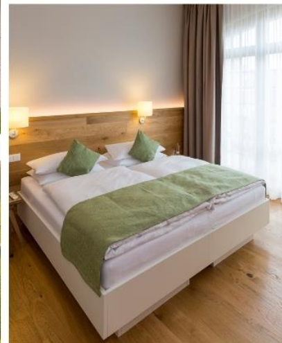
Bild: Paulinen Hof Seminarhotel mit dem GreenSign zertifiziert

Das Team des Paulinen Hof Seminarhotels sieht sich in der Verantwortung, ökonomisch, ökologisch und sozial nachhaltig zu handeln. Eine transparente Unternehmensführung gehört ebenso zum Konzept wie ein faires Miteinander im Team und ein respektvoller Umgang mit Ressourcen.