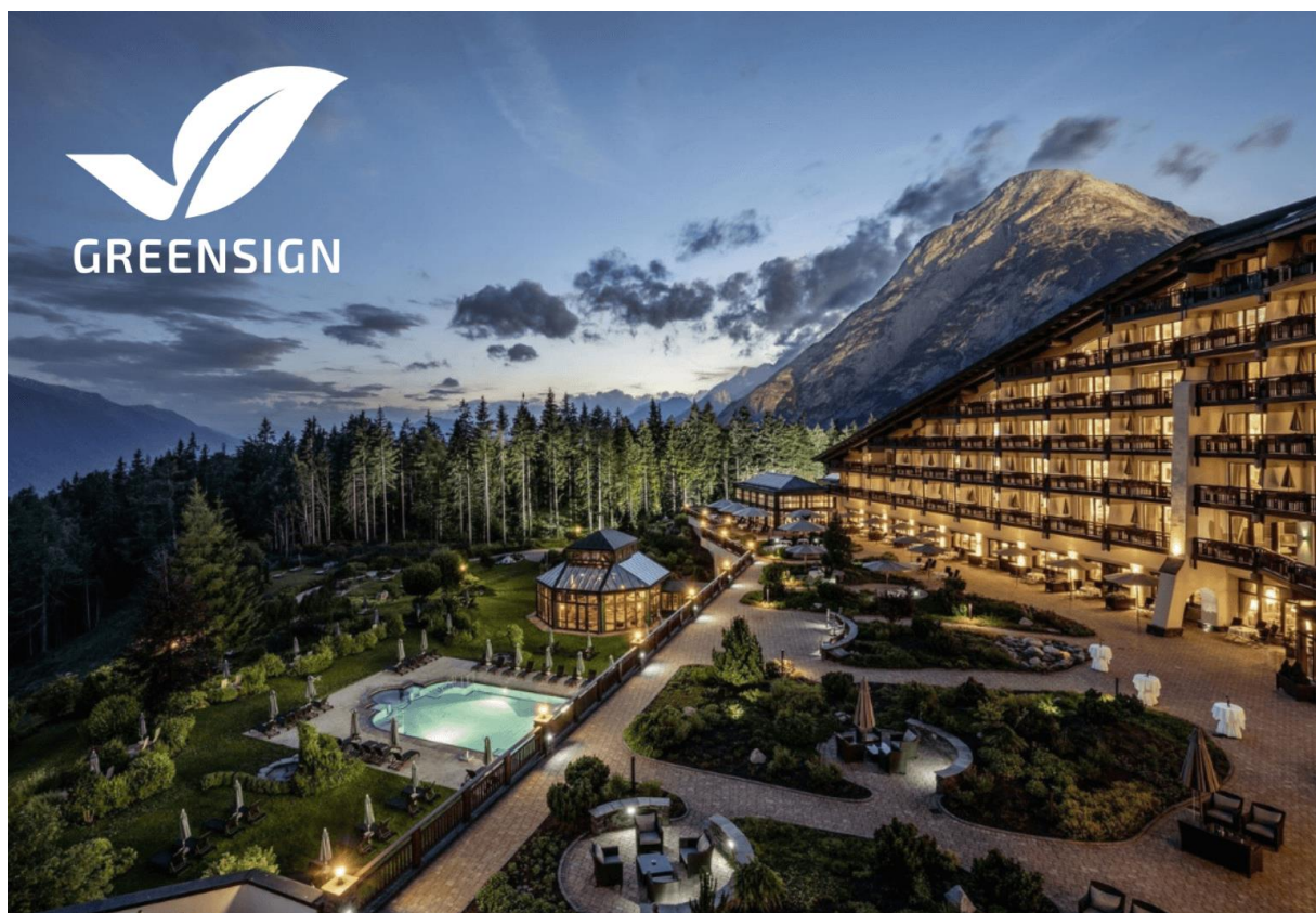
Bild: GreenSign goes Austria: Top Ergebnisse bei der Nachhaltigkeits-Zertifizierung Österreichischer Hotels

In Deutschland ist die vom GreenSign Institut im Jahr 2014 entwickelte Nachhaltigkeitszertifizierung für Hotels bereits Marktführer. In diesem Jahr wurde der GreenSign Zertifizierungsstandard für Hotels sogar vom weltweit bekannten Globalen Rat für nachhaltigen Tourismus, dem Global Sustainable Tourism Council anerkannt. Dieser Meilenstein, dem etwa ein ganzjähriger Prozess vorausging, bietet heute eine gesteigerte Wertigkeit der GreenSign Hotelzertifizierung auf dem internationalen Markt.