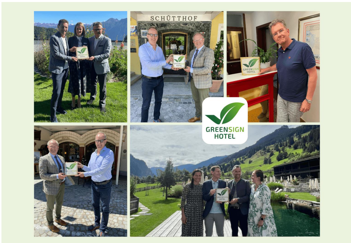
Bild: GreenSign Zertifikatsübergabe Österreichischer Hotels: Interlpen Hotel Tyrol, Der Schütthof, Theaterhotel & Suites Wien, Hotel Latini Zell am See, Moar Gut v.l.o.